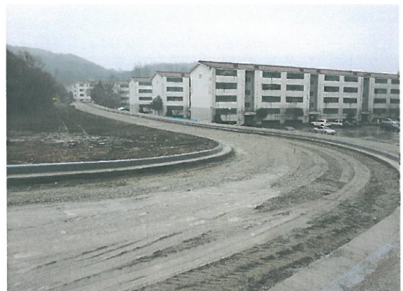
< 풍안마을~ 특공1대대간 도로개설 >