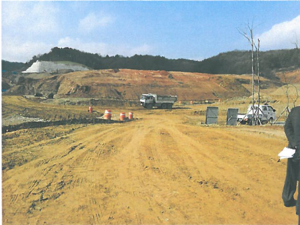
< 계룡1 농공단지 조성 >