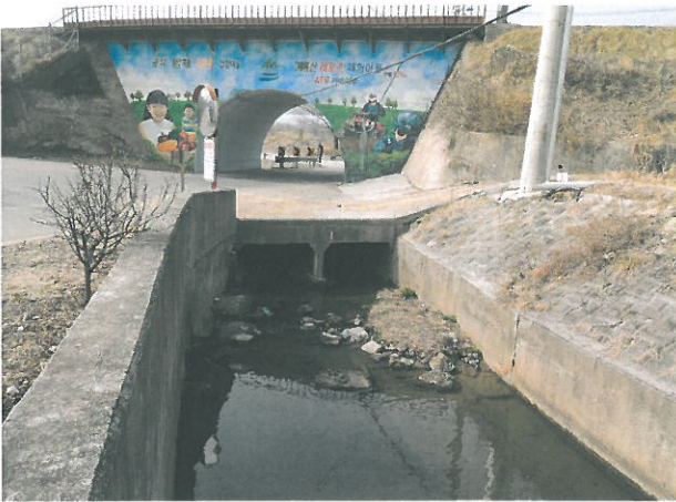
< 광석골다리 재해위험지구 정비 >