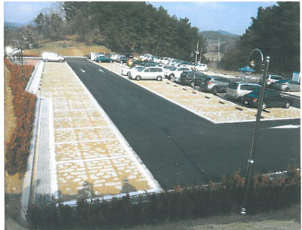
< 계룡역 공영주차장 >