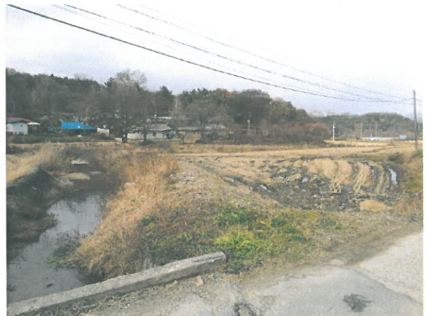
< 하대실 도시개발사업 >