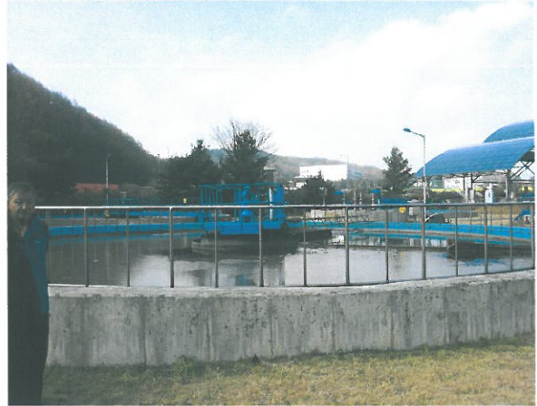
< 공공하수처리시설 >