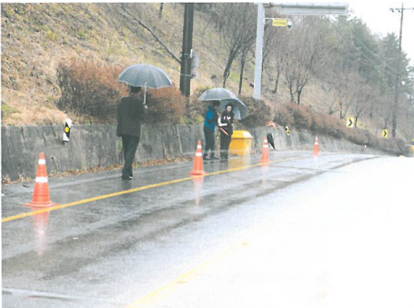
< 밀특재 자동염수분사장치 설치 >