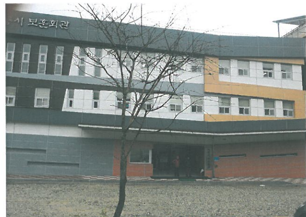
< 보훈회관 >