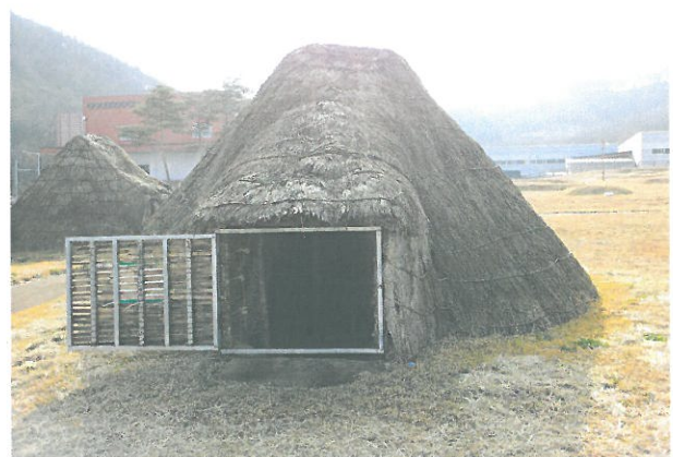
< 입암 유적공원 보수정비 >