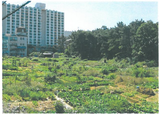
< 양정지구 기반시설 확충 >