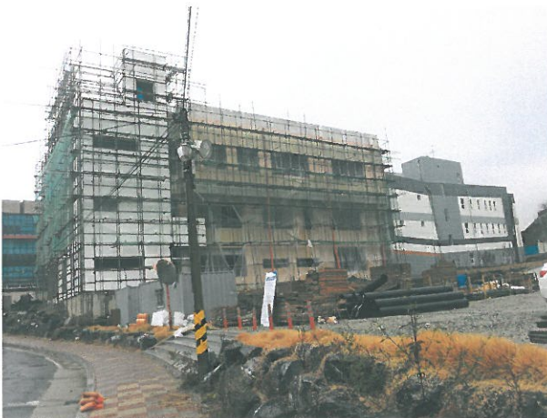
< 업사 주민자치센터 신축 >