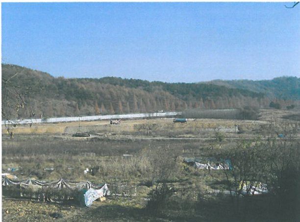
< 대실 도시개발사업 >