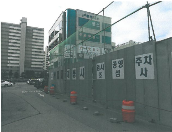
< 업사 공영주차장 조성 >