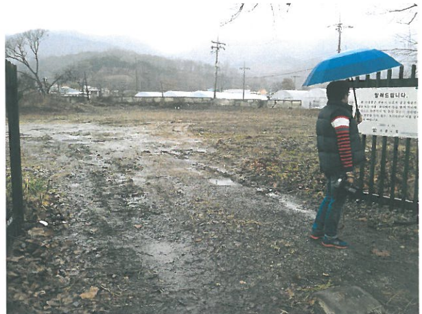
< 도곡리 어린이감성체험장 조성 >