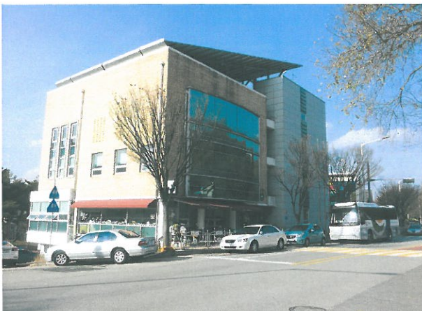
< 노인종합복지관 >