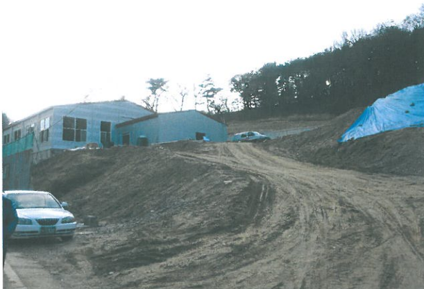
< 두계근린공원 조성 >